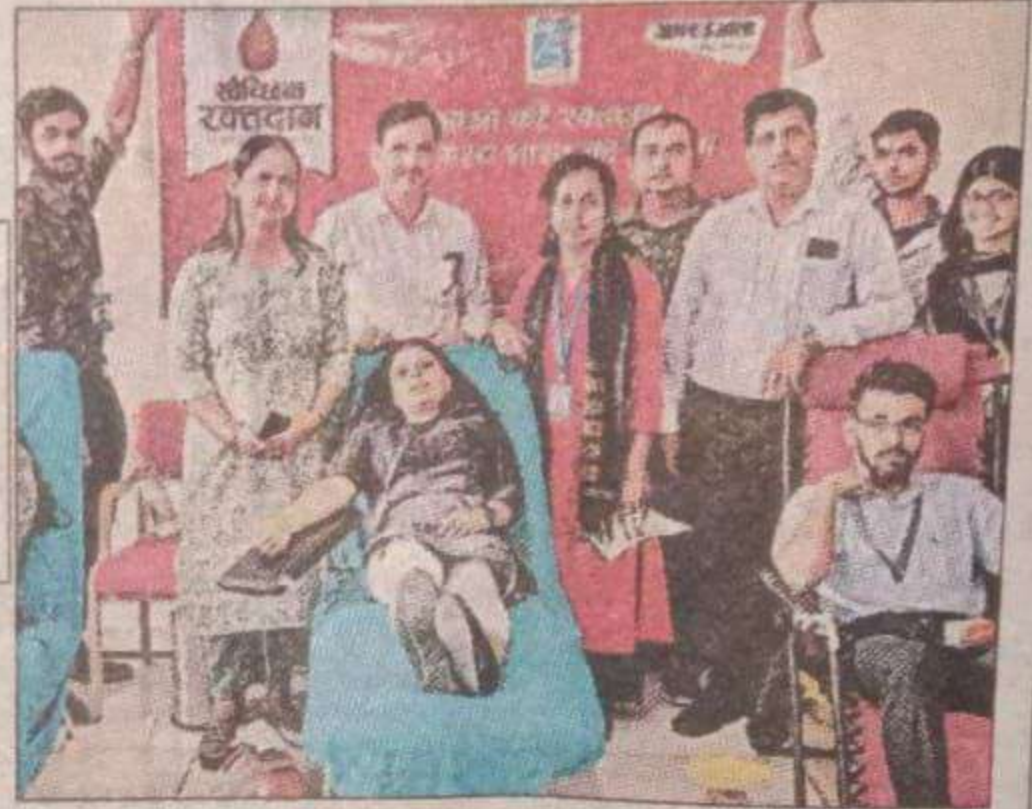
शिविर में रक्तदान करते लोग। संवाद